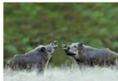
Foto ganadora del Primer Premio Internacional de Fotografía FICAAR 2010.