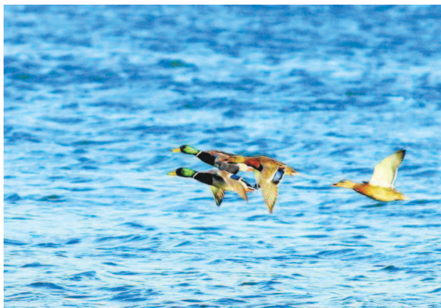
Ánades reales en vuelo.

Navarra, que la pauta general es que las capturas de codorniz han sido en general escasas, sobre todo en la zona norte que ha empezado desastrosa, por lo que tendremos que perseverar a que se muevan las que están más al norte. Sin embargo, las fuertes tormentas que cayeron 3 días antes de la apertura en la zona pirenaica, han provocado que en determinados cotos de la zona media que disponen de zonas de regadío, como por ejemplo, Cáseda, la zona de Ejea de los Caballeros, y otros cotos de la zona media como Pitillas y alguno de la ribera alta, arribaron desde el viernes bandos de ejemplares de codornices de pasa que seguramente se desplazaron desde el norte, permitiendo a los asombrados cazadores de estos cotos unas dignas perchas que ni pensaban que iban a hacer.