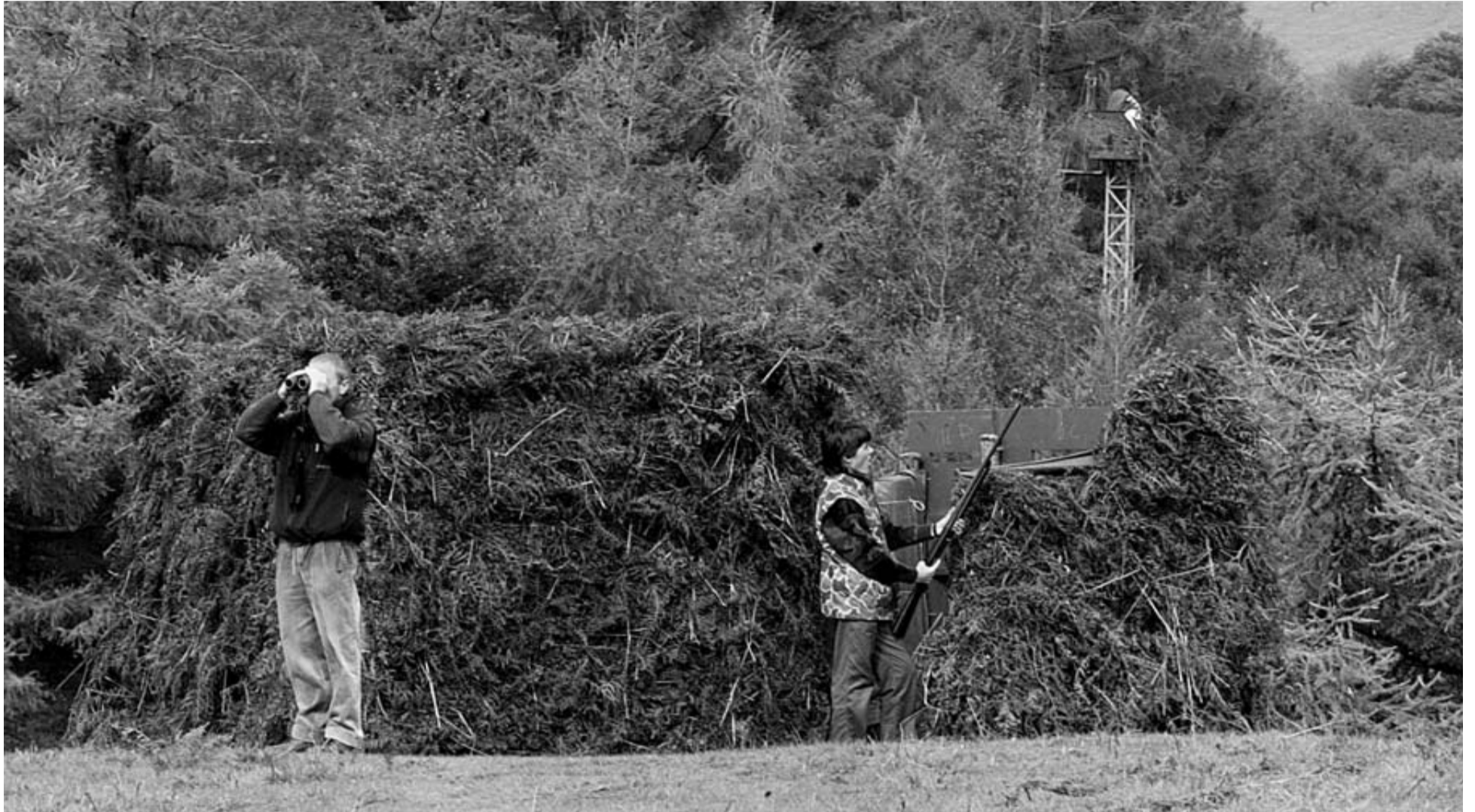
Imagen de caza de la paloma en el collado Iarmendi en Etxalar. En esta zona, los cazadores indican que ha sido una temporada mala. "Cada vez pasan menos palomas", dicen. GOÑI-BUXENS

Los cazadores definen como irregular la temporada de la paloma en Navarra