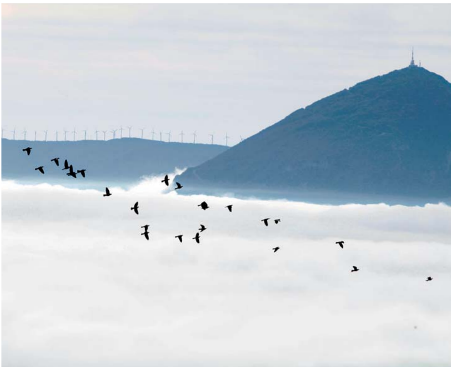
Un bando de torcaces sobrevuela el manto de niebla que ayer por la mañana cubrió la cuenca de Pamplona. Al fondo, la Higa de Monreal.

Según los censos llevados a cabo ayer por la mañana en los puestos de observación de Francia y Navarra, unas 600.000 palomas torcaces cruzaron por los tres pasos pirenaicos